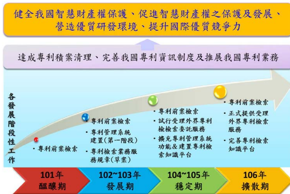
圖 4 中心發展願景規劃

本中心業務施作目標及計畫主要分有：進行智慧局委託之專利申請前案檢索、受理外界專利檢索委託及完善專利資訊系統平台等範疇。目前工作首重協助智慧局專利前案檢索以達清理專利積案之目標，並依醞釀期與發展期所累積之檢索經驗，建置專利管理知識庫平台，以有效管理檢索人員之服務效率、提升檢索效能，亦可作為後續受理產學研各界委託或相關諮詢業務之管理作業平台。進入穩定期後，陸續啟動受理產學研各界檢索案件之委託，逐步助益產學研各界完備研發前之各項資訊，使其研發投資能創造最大效益，發揮本中心最大設立功能（圖 4）。