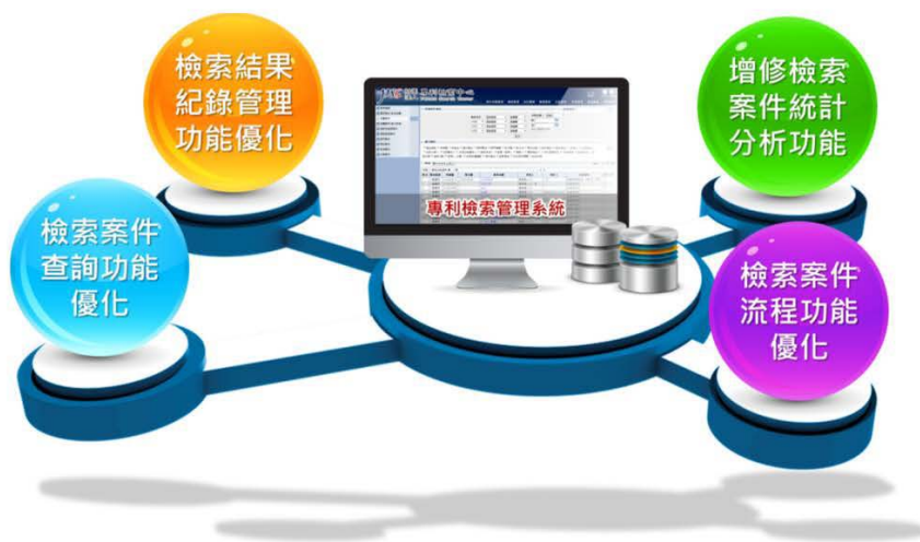
圖 2 專利檢索管理系統－優化功能範圍

104 年度完成「優化專利檢索管理系統功能」（圖 2）及「擴充開發對外案件流程管理子系統功能」（圖 3），除了可有效管理對智慧局服務案件流程，更使對外（智慧局以外的單位）專利檢索服務業務可有效擴展及管理，持續強化專利檢索服務品質。