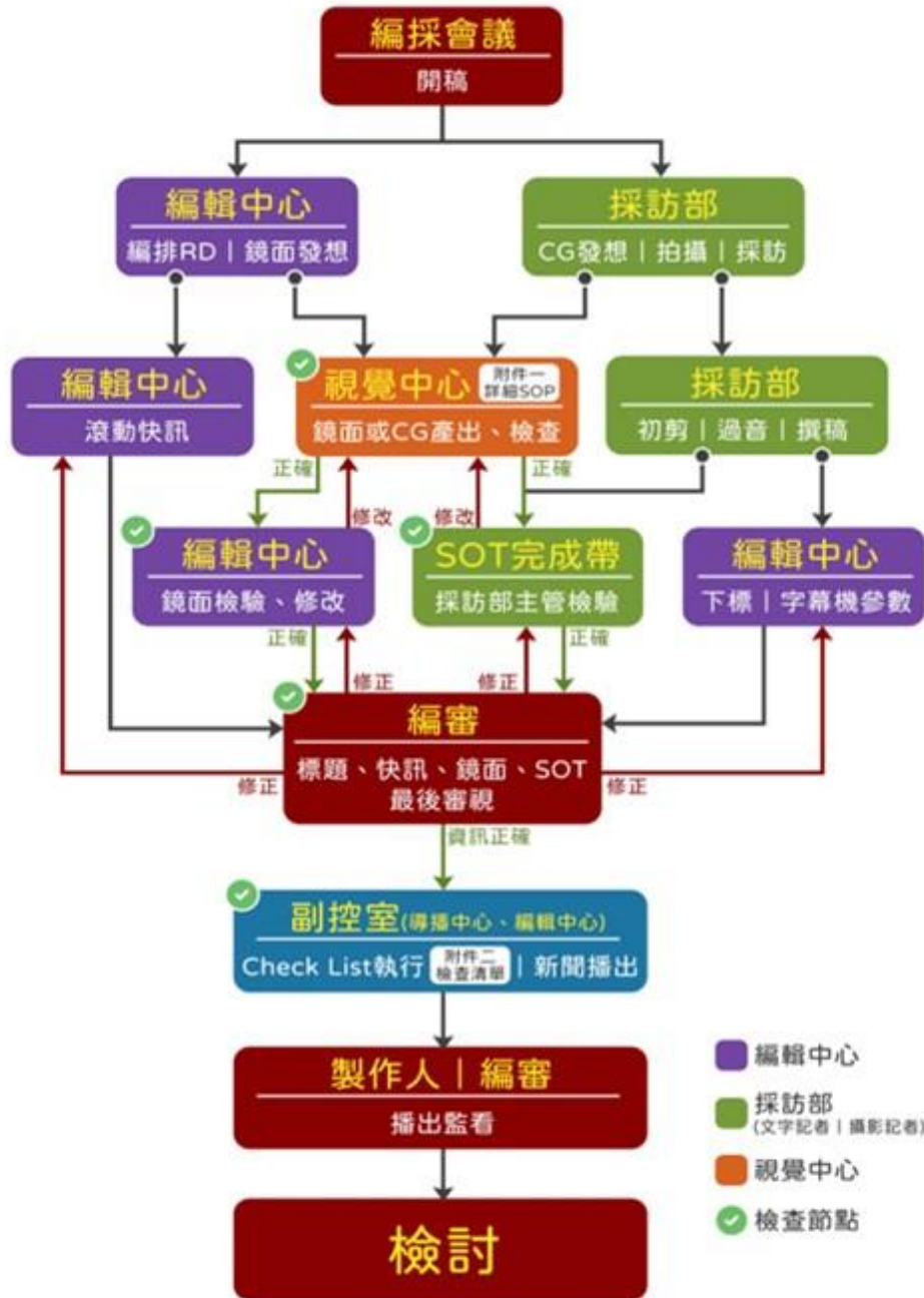
另規範鏡面與CG（電腦繪圖卡）製作審核流程，亦提列5個檢視節點。（下圖二）