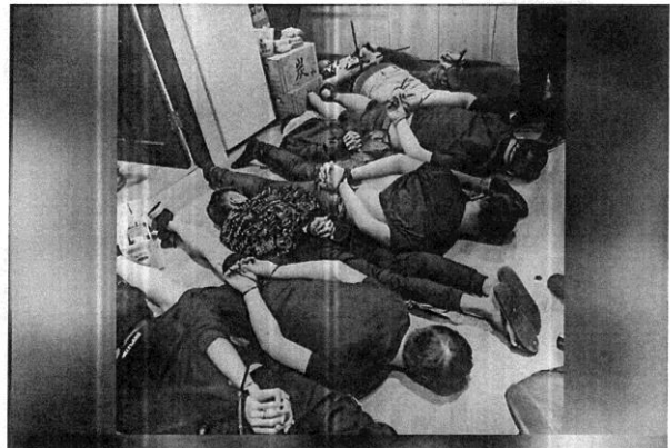
台版柬埔寨求職詐騙案，集中營式囚禁58人，還鬧出3條人命，詐騙集團手段凶殘，被害人一進屋就被搜身抽財、嘴塞毛巾，上手銜、腳綁束帶，丟進5坪大房間，如果交談就被毒打凌虐，還嚴毒品FM2控制行動。

Facebook 李貴敏 Instagram Legislator.stacey