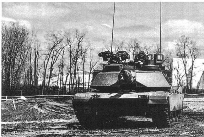
台美今年7月舉行「陸軍新型戰車專案管理會議」期間，美方安排我方人員試乘第一輛改裝的M1A2T戰車。