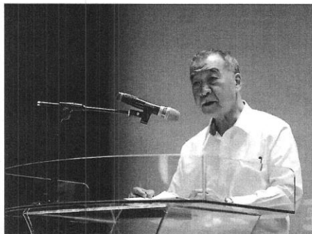
國防部長邱國正日前主持「國軍111年部隊工作策進會議」。