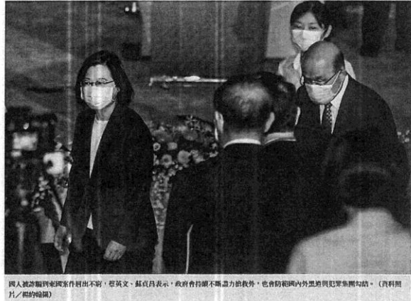
國人赴游騙到地國案件出不窮，蔡英文、蘇貞昌表示，政府會持續不斷盡力搶救外，也會防範國內外黑道與犯罪集團勾結。