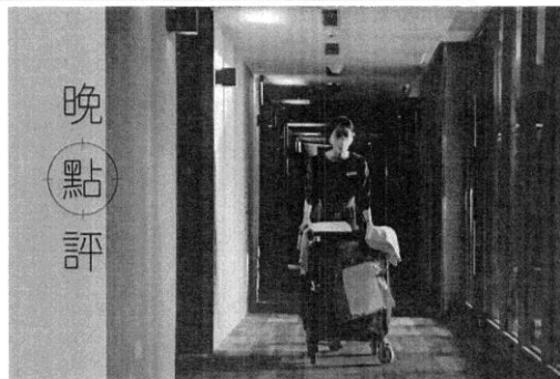
開放旅宿移工，旅宿業者樂見其成，但勞團、學者皆持反對意見。此為示意圖，照片中人物與新聞無關。