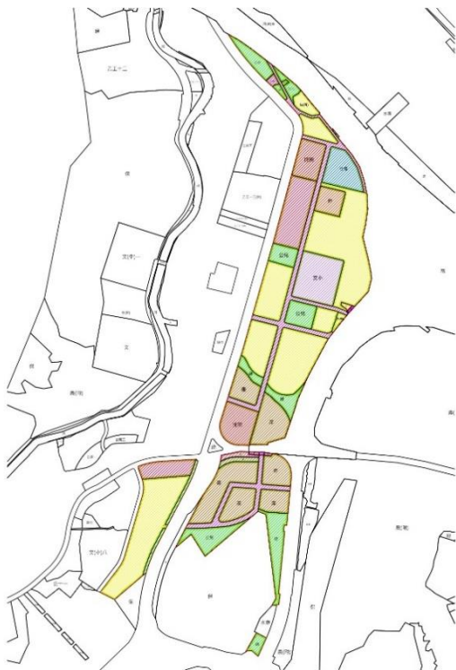
新店都市計畫第三次通盤檢討案 D 單元