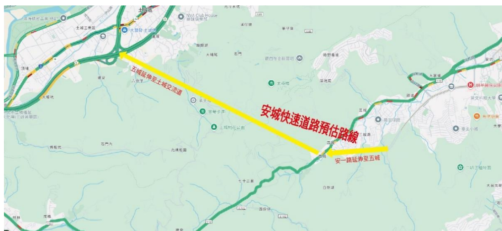
安坑一號道路延伸至土城交流道（安城快速道路）路線圖