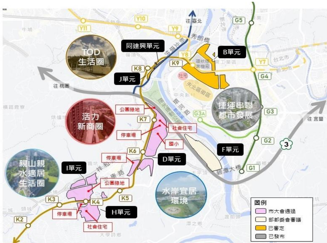
新店都市計畫第三次通盤檢討案中的 D、H、I 單元