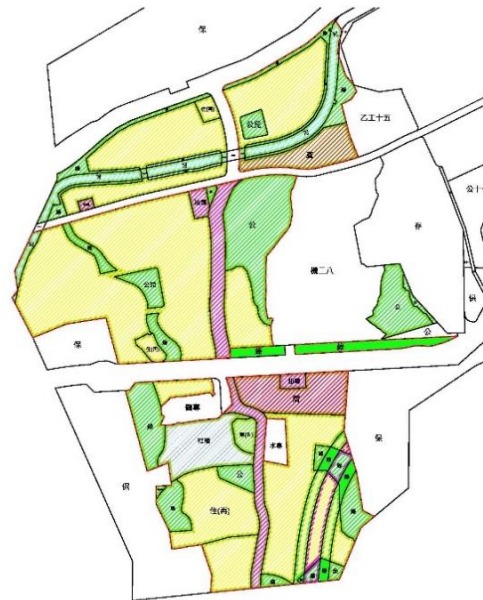
新店都市計畫第三次通盤檢討案 H、I 單元